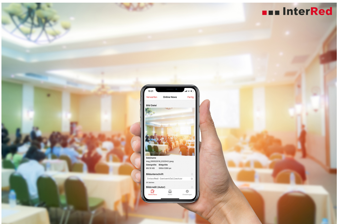
Die InterRed ContentCollector App: mobiles Arbeiten für Redakteure und Fotografen

Der genaue Workflow und die Entscheidung, was mit über die App gelieferten Inhalten geschehen soll, kann je Kunde individuell angepasst werden. Hierbei eingebunden werden die in InterRed bekannten, vielfältigen Freigabeprozesse, Rechtedefinitionen und Workflowstatus, so dass die ContentCollector App zielgenau auf die jeweiligen Strukturen und Bedürfnisse angepasst werden kann. Diese Flexibilität ermöglicht es beispielsweise, die Inhalte vorerst nur zur spä-